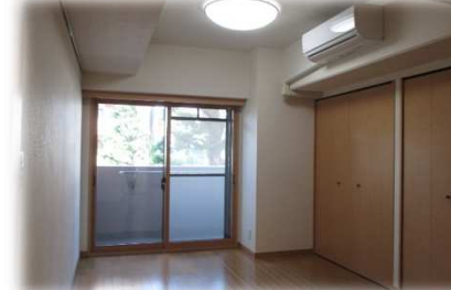
図面と現状が異なる場合、現状を優先とします。